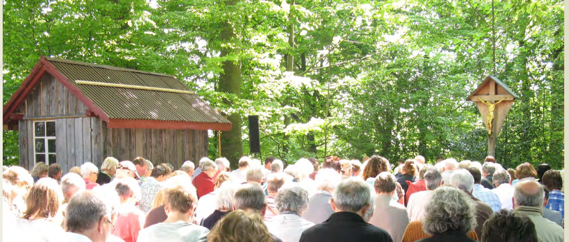
SEMA-Gottesdienste – Auffahrt 2017 in Wolfertswil