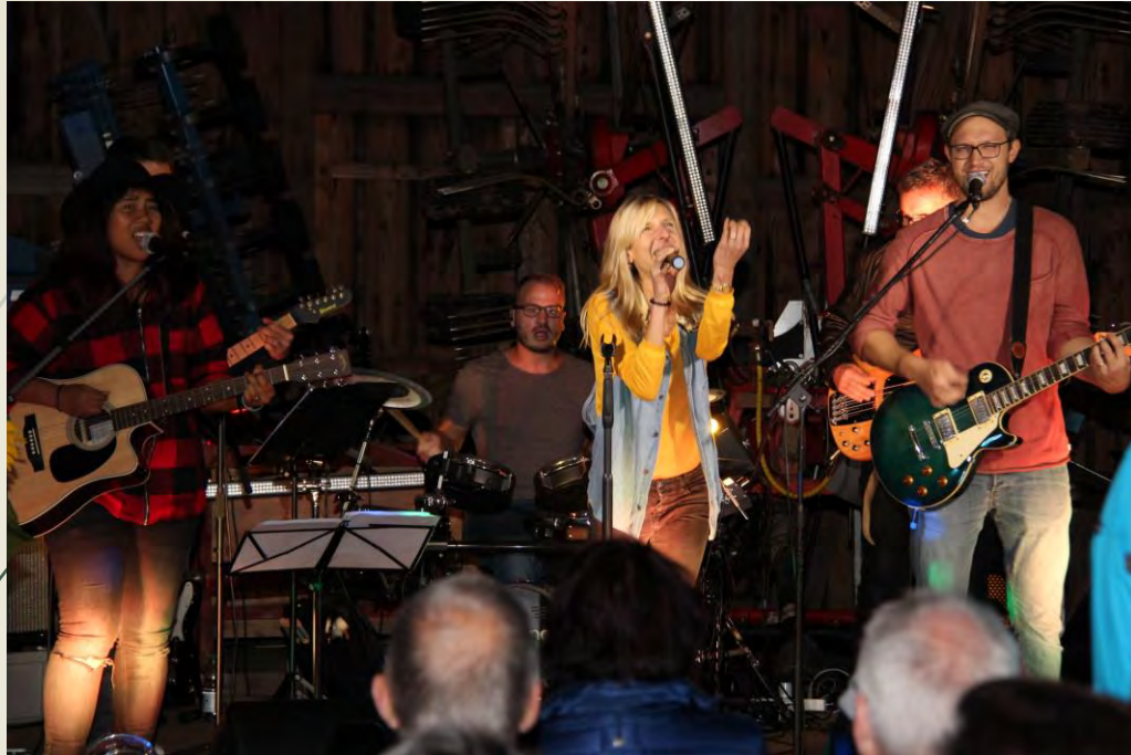
Spirit am Weiher mit Band die rockt